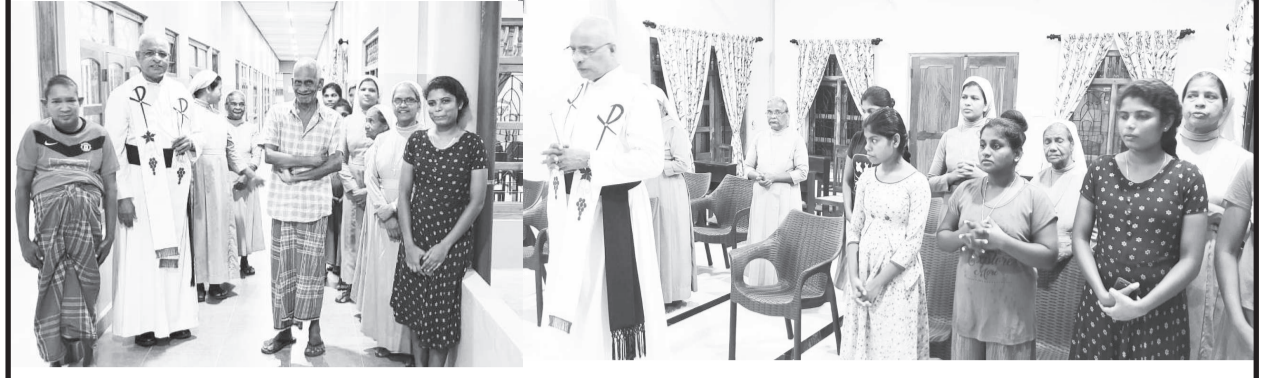
கொழும்புத்துறை புனித சூசையப்பர் முதியோர் இல்லத்தின் புதிய கட்டடத் தொகுதிக்குள் தங்க வைக்கப்பட்டுள்ள முதியவர்கள்.