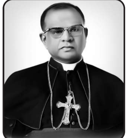
பெருநிலப்பரப்பின் கடினமான பணிகள்

எப்பவும் கருத்தடை செய்வது இல்லை மிருக ஜாதி அது மட்டுமல்ல மிருக ஜாதி அழிப்பதுமில்லை கரு கர்ப்ப காலத்தில் மிருக ஜாதி கொள்வதில்லை தாம்பத்திய உறவு புனிதமான மிருக ஜாதியின் ஓலைக் குடிசையில் தான் பிறந்தார் இயேசு பாலன் - பிறப்பு மாற்றங்களின் நுழைவாயில் நீ உண்மையாக மாறுவது தான் தேடல்களின் பாதை மனம் தூய்மையாக இருந்தால் சாபங்களாக மாறுவதில்லை வராங்கள் நீ நீயாக இருக்கலாமே தவிர தனியாக இராதே இப்போது தனிமை என்பது செல்போன்களுக்கு இரை நீ விதைக்கப்பட வேண்டிய விதை உன்னில் முளைக்கவே கூடாது சுயநலன்கள் விளைந்த போதைப் பொருட்கள் நீ கைவிடப்பட வேண்டியதை கைவிட்டால் உன்னில் இருந்து உனக்கு மீட்பு நீ மக்களை நேசித்தால் உன்னால் உலகத்துக்கு மீட்பு - உவிரோவியன்