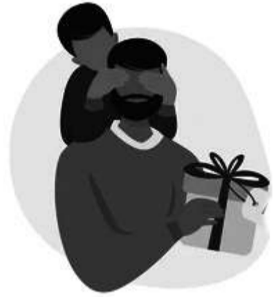
அப்பா அதிர்ந்து போய் விழிகள் தெறிப்பதுபோல் பார்த்துக்கொண்டிருக்க

உழத்தவள் கிளாஸ்களில் சாராயத்தை ஊற்றி, தம்பியின் கிளாசோடு முட்டி விட்டு, வாயில் வைத்து இரண்டு மிட்டு விழுங்கியிருப்பாள், “டேய்...” உயிரே போனதுபோல அறியாபடி பாய்ந்து சென்று தன் மகன்மாரைத் தாறு மாறாக அடித்தான். அழுகைக் குரலில் “அம்மா... பாத்தீங்களா... இந்த அறியாயத்தை..” என்று தழுதழுக்க ‘தந்தை எவ்வழியோ மைந்தர்களும் அவ்வழி...’ பெரிய வங்க சும்மாவா சொன்னாங்க என்று வேதனைக்குரலில் கூறியபடி “தொண்டை எரியுது... வாய் எரியுது...” என்று அழுத சிறுவர்களை அணைத்துக் கொண்டு வெளியே சென்றார். அன்று யாருமே சாப்பிடவில்லை. பிள்ளைகள் அழுதபடி தூங்கி விட்டார்கள். அம்மா மெதுவாக எழுந்து ஓசை வராமல் உள்ளறையை எட்டிப் பார்த்தார். அங்கு மகன் தலை கலைந்து, முகம் வெளிநிச்சுவரோடு சுவராகச் சாய்ந்து உட்கார்ந்திருந்தான். சாராயப் போத்தல்களும், டம்ளர்களும் சிதறிக் கிடந்தன. கண்களில் கண்ணீர் வழிந்தது. அம்மாவுக்குள் நம்பிக்கை பிறந்தது. தன் பேரப்பிள்ளைகள் கொடுத்த புதுவருடப் பிறப்புப் பரிசு என்றும் மறக்க முடியாத நினைவுப் பரிசு. இனிமேல் மகன் குடிக்க மாட்டான் என நினைத்து மகிழ்ச்சியோடு குழந்தை இயேசுவுக்கு நன்றி கூறினார்.